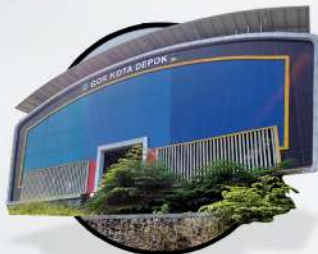
GOR KOTA DEPOK