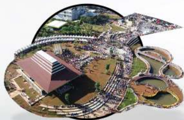
ALUN-ALUN KOTA DEPOK